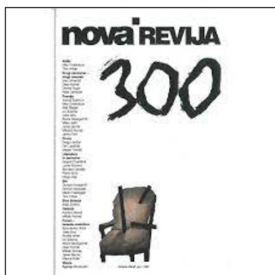
Юбилейный 300-й номер «Новой ревии»

от текущей политической конъюнктуры, преследуя цель «монополизировать свой вклад в обретение нацией государственного суверенитета» 1 . В 2010 г. издание журнала прекращается. Важнейшим в его послужном списке остается десятилетие 1982–1992, когда, отказавшись от традиционного амплуа «толстого» литературного журнала –