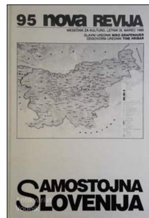
95-й номер журнала «Нова ревия»