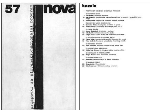
57-й номер журнала «Новая ревия»