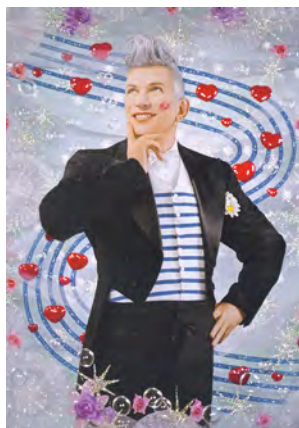
© Pierre et Gilles © Rmn – Grand Palais, Paris 2015

Ретроспектива Кунса в Центре Жоржа Помпиду включала работы из серий «Сделано на небесах», Vanality и Celebration. Из нового – скульптуры, выполненные в традиционной для Кунса технике (металл, отполированный и выкрашенный), воспроизводящие античные образцы.