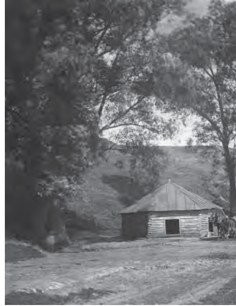
Прощенский колодец в Скопине, 1927 г.

Повышенный интерес к отечествоведению нельзя объяснить только личной склонностью мемуариста, а его литературный труд вписать в строгие каноны семейных хроник и краеведческих заметок предшествующих, менее динамичных эпох. В скрупулезном, порой избыточном описании мельчайших деталей ускользающего прошлого (дощечка от дорожного сундука, яйцо цесарки, большие старинные часы, кусок мореного дуба, граммофонные пластинки, иконы и многое другое) прослеживается характерная особенность минувшего столетия. Периода, когда «трагедия старинных российских местностей – сел и деревень, разоренных хаосом войны и продразверсткой, городов, в произволе нового хозяйственного планирования утративших свое историческое значение и место в политэкономической картины родины, болью отозвалась в сердцах писателей (а говоря шире, образованных, склонных к литературной рефлексии и болеющих за судьбу своего края людей. – В. У.), выдвинув “драматическую местность” в структурно-конструктивный, определяющий момент их творчества» 1 .