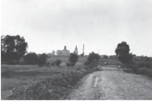
Подход к Журавинке из Вороновки, 1954 г.

Повышенный интерес к отечествоведению нельзя объяснить только личной склонностью мемуариста, а его литературный труд вписать в строгие каноны семейных хроник и краеведческих заметок предшествующих, менее динамичных эпох. В скрупулезном, порой избыточном описании мельчайших деталей ускользающего прошлого (дощечка от дорожного сундука, яйцо цесарки, большие старинные часы, кусок мореного дуба, граммофонные пластинки, иконы и многое другое) прослеживается характерная особенность минувшего столетия. Периода, когда «трагедия старинных российских местностей – сел и деревень, разоренных хаосом войны и продразверсткой, городов, в произволе нового хозяйственного планирования утративших свое историческое значение и место в политэкономической картины родины, болью отозвалась в сердцах писателей (а говоря шире, образованных, склонных к литературной рефлексии и болеющих за судьбу своего края людей. – В. У.), выдвинув “драматическую местность” в структурно-конструктивный, определяющий момент их творчества» 1 .